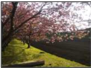
見事に咲いた八重桜 石崎地主海神社にて

さて、わが福祉業界も介護報酬改定の荒波がようやくひと段落し、今年度の取り組みに着手しはじめたところです。さらに当センターでは、人事異動に伴う職員の入れ変わりがあり、新しい職員を迎え新たな気持ちで新年度のスタートを切っております。巻末では新任職員の紹介をしておりますので、センターともどもよろしくお願い申し上げます。