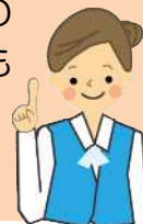
主任介護支援専門員

対象の方が、65歳以上で 担当地域にお住まいであれば ご本人やご家族だけではなく 近隣住民の方々、地域の金融 機関やコンビニやスーパーの 従業員の方など、どなたでも ご相談頂けます。 又、秘密も厳守します。